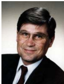
Vorwort von Rainer Trieschmann

Nach dem Jubiläumsjahr startet der LSV 07 in die nächsten 100 Jahre. Dazu werden engagierte Mitglieder gebraucht. Bitte kommen Sie zur Mitgliederversammlung am 18. 4. 08